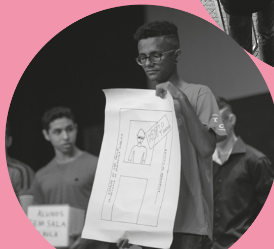
Alunos SEM SALA DE SALA