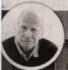
Os primeiros autores da 19ª edição

Tanto o Combinando Palavras quanto o Recortando Palavras seguem as diretrizes do