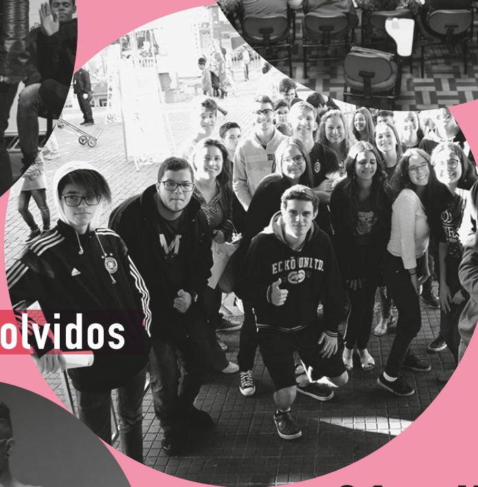
Combinando Palavras - Alunos