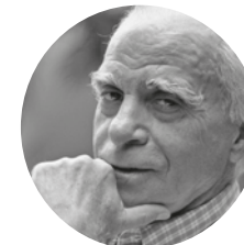
Ignácio de Loyola Brandão