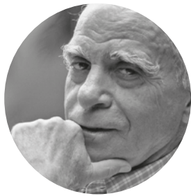
Ignácio de Loyola Brandão