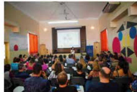
Os dois projetos foram apresentados nesta quinta-feira (22) para coordenadores da rede municipal de ensino.

Pesquisa mostra que quase 70% dos brasileiros não têm plano de saúde