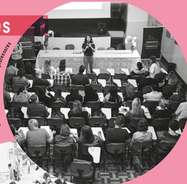
Oficinas de formação com professores