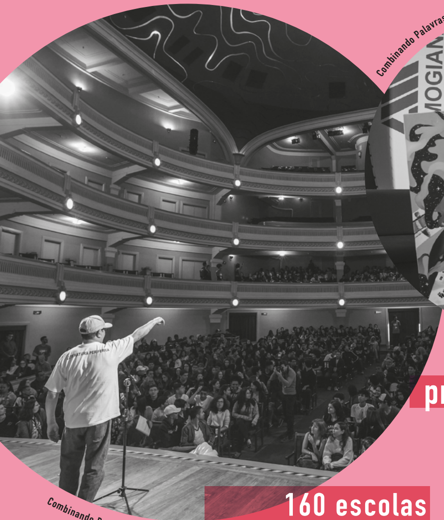
Combinando Palavras - Sérgio Vaz

14 cidades da região participam anualmente do projeto