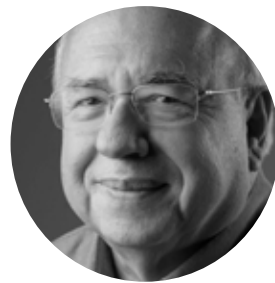
Luis Fernando Veríssimo