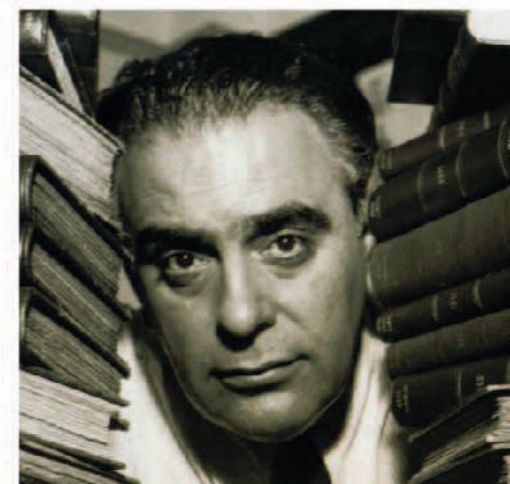
José Olympio Patrono permanente

José Olympio Pereira Filho, batataense, foi um grande editor e livreiro brasileiro, fundador da Livraria José Olympio Editora, no Rio de Janeiro, em 1931. Entre as décadas de 1940 e 1950 tornou-se o maior do País, publicando 2 mil títulos, com 5 mil edições. São obras que nos anos de 1980 atingiram 30 milhões de livros de 900 autores nacionais e 500 estrangeiros.