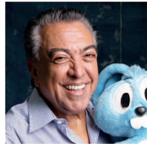
Maurício de Sousa Escritor homenageado

Ele é o maior cartunista brasileiro. Criador da Turma da Mônica e, de vários outros personagens de história em quadrinhos, recebeu diversos prêmios nacionais e internacionais pelas suas criações. Hoje, é o mais famoso e premiado autor brasileiro de História em Quadrinhos e, ocupa a cadeira nº. 24 da Academia Paulista de Letras.