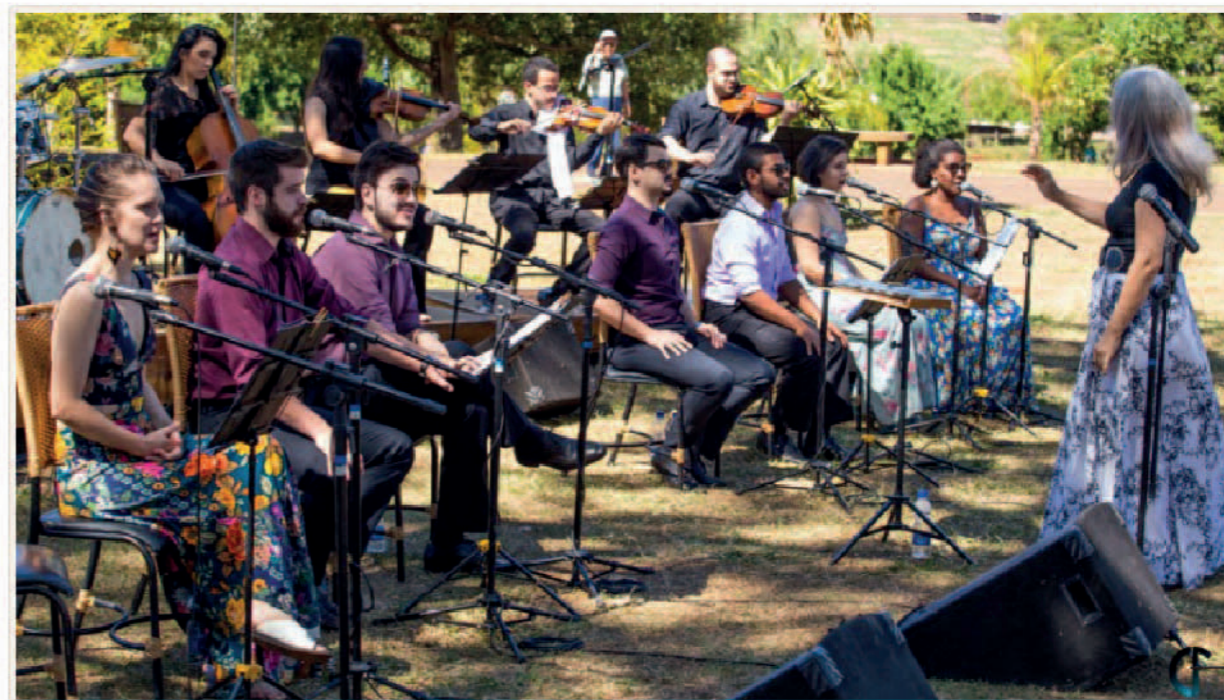
Apresentação musical Viola Enluarada com Cia Minaz